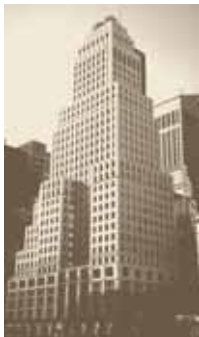
Auda 745 Fifth Avenue New York

In diesem Zusammenhang haben wir mit Auda, New York, eine der weltweit führenden Private Equity-Dachfondsmanagement-Gesellschaften mit einem Erfahrungswachstum von über 19 Jahren mandatiert. Mit dem nun vorliegenden Investment bieten wir anspruchsvollen Privatinvestoren zum ersten Mal die Möglichkeit, in einen weltweit agierenden Dachfonds zu investieren, der von Auda gemanagt wird. Wir sind überzeugt davon, dass wir Privatinvestoren mit diesem Private Equity-Investment einen bedeutenden Mehrwert bieten und damit den erforderlichen, ausgewählten Zugang ermöglichen.